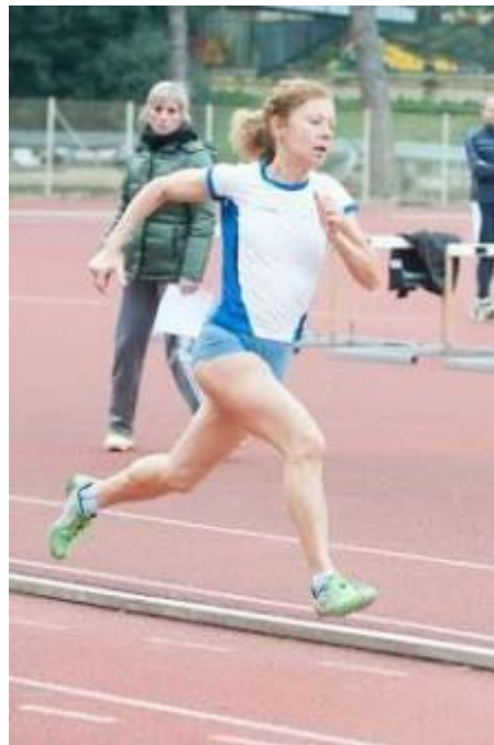
Anna ancora un primato

Tutti i risultati completi della manifestazione http://www.fidal.it/risultati/2015/REG7854/Index.htm